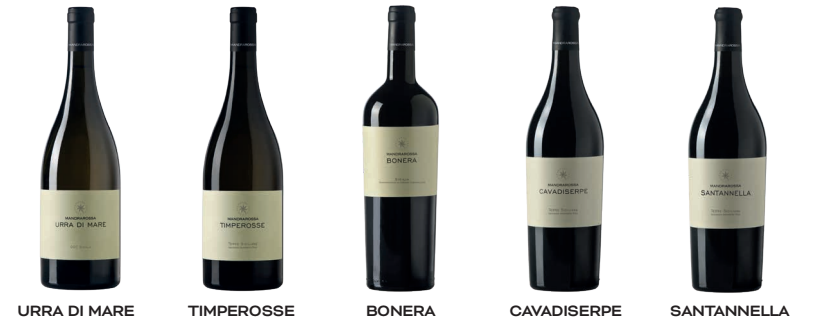
URRA DI MARE TIMPEROSSE BONERA CAVADISERPE SANTANNELLA