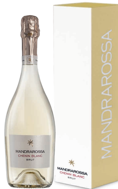
1 VINO SPUMANTE BRUT METODO CHARMAT 2020 CHENIN BLANC TERRE SICILIANE IGT

Astuccio singolo in cartotecnica contenente 1 bottiglia da 750 ml Single gift pack in paper packing containing 1 x 750 ml bottle