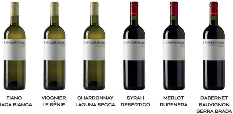
FIANO CIACA BIANCA VIOGNIER LE SÈNIE CHARDONNAY LAGUNA SECCA SYRAH DESERTICO MERLOT RUPENERA CABERNET SAUVIGNON SERRA BRADA