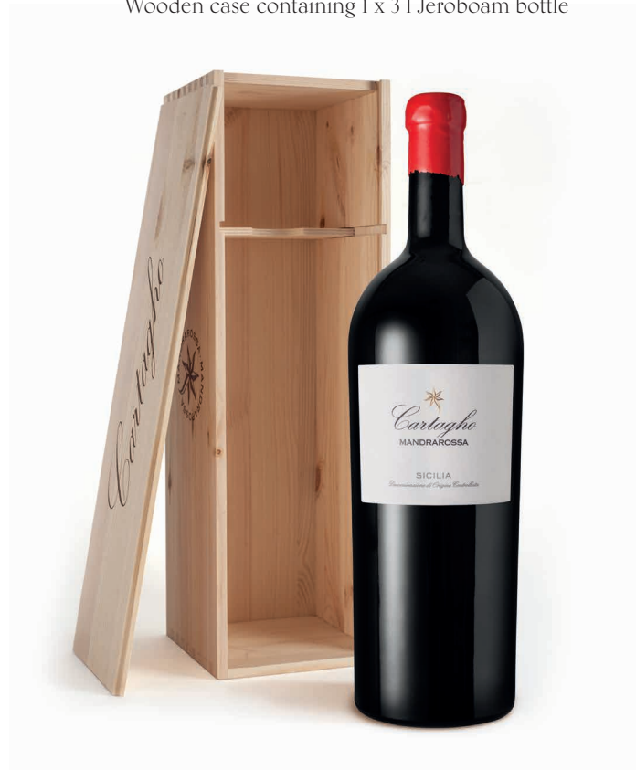
1 CARTAGHO 2018 - ROSSO SICILIA DOC

Cassetta in legno contenente 1 Jeroboam da 3 l Wooden case containing 1 x 3 l Jeroboam bottle