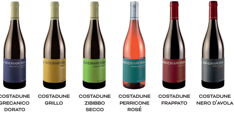
COSTADUNE GRECANICO DORATO COSTADUNE GRILLO COSTADUNE ZIBIBBO SECCO COSTADUNE PERRICONE ROSÉ COSTADUNE FRAPPATO COSTADUNE NERO D'AVOLA