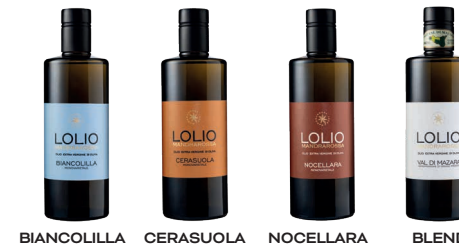
BIANCOLILLA CERASUOLA NOCELLARA BLEND