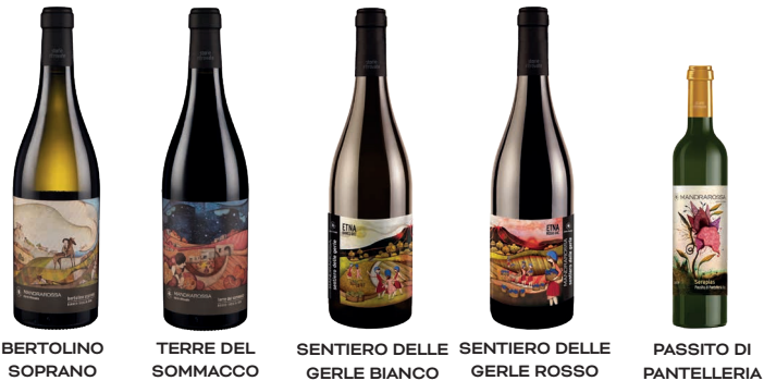
BERTOLINO SOPRANO TERRE DEL SOMMACCO SENTIERO DELLE GERLE BIANCO SENTIERO DELLE GERLE ROSSO PASSITO DI PANTELLERIA