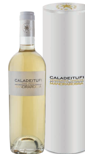
1 CALADEITUFI 2015 - VENDEMMIA TARDIVA MENFI DOC

Astuccio singolo cilindrico in cartotecnica contenente 1 bottiglia da 500 ml Single gift pack in paper packaging containing 1 x 500 ml bottle