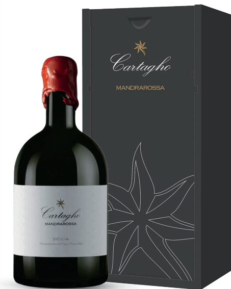
1 CARTAGHO 2018 - ROSSO SICILIA DOC