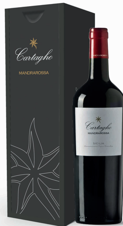
1 CARTAGHO 2018 - ROSSO SICILIA DOC

Cassetta in legno contenente 1 bottiglia da 750 ml Wooden case containing 1 x 750 ml bottle