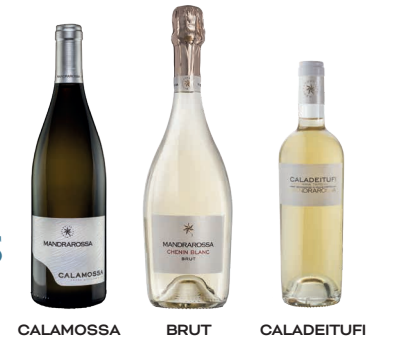
CALAMOSSA BRUT CALADEITUFI